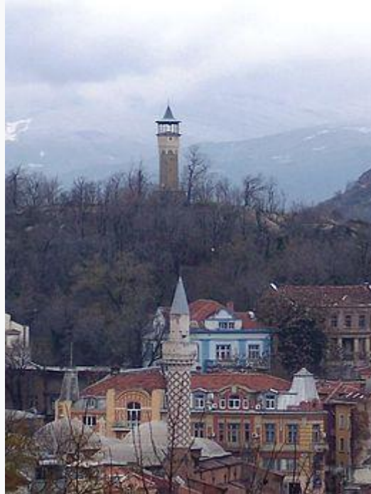
Toren oude stad