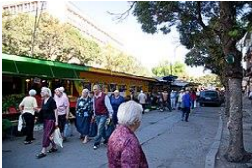
De 'vrouwenmarkt' (zjenski pazar) van Sofia

Op 31 december 2019 telde de gemeente Sofia 1.328.790 inwoners, waarvan 1.242.568 in de stad Sofia zelf en de rest in de kleinere dorpen en voorsteden. [2] De bevolking van Sofia is de afgelopen decennia langzaam maar geleidelijk toegenomen, in tegenstelling tot de rest van het land (zie: onderstaand tabel). De bevolkingsgroei is het gevolg van de intensieve (binnenlandse) immigratie uit kleinere steden en het omringende platteland. In 2019 woonde bijna een vijfde deel van de Bulgaarse bevolking in of rondom de stad Sofia. Vanwege de binnenlandse immigratie heeft slechts een klein deel van de Sofioten familiewortels uit Sofia. De oorspronkelijke Sofioten worden ook wel 'Sjopi' genoemd in de volksmond en spreken van oudsher West-Bulgaarse dialecten.