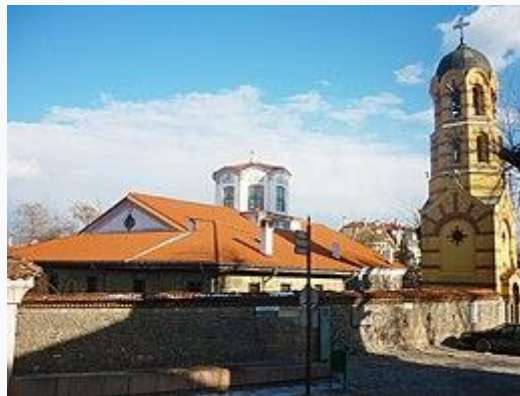
Kerk Sint Nedelja

Plovdiv is een van de weinige nederzettingen in Bulgarije met een positieve bevolkingsgroei. In de periode tussen 2018 en 2019 steeg de bevolking met +958 mensen (+0,3%) naar een hoogtepunt van 347.851 inwoners. In het jaar 2018 werden 3.342 kinderen geboren, terwijl er zo'n 4.168 inwoners kwamen te overlijden. [2] De natuurlijke bevolkingsaanwas was (net als de voorafgaande jaren) negatief en bedroeg -826 mensen. Verder vestigden zich 7.502 inwoners in Plovdiv, terwijl 5.718 inwoners de stad verlieten. [3] Het migratiesaldo was positief en bedroeg +1.784 personen.