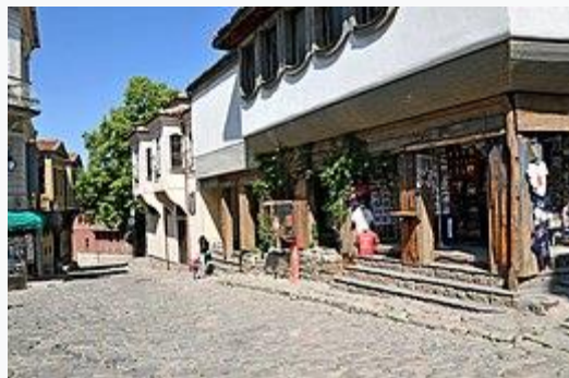
De oude binnenstad

De stad biedt een moderne aanblik, mede door de heropbouw na een zware aardbeving in 1928. Niettemin is de oude stad geheel opgetrokken in de traditionele Bulgaarse bouwstijl en heeft de status van openluchtmuseum. In de omgeving zijn resten gevonden van een oude Thracische vesting en van een Romeins amfitheater. Eveneens in de buurt van de stad liggen belangrijke, historische, Oosters-orthodoxe kloosters en kerken.