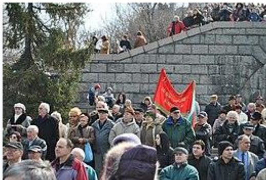
Inwoners van Plovdiv vieren de bevrijding op 3 maart

Op 31 december 2019 telde de stad Plovdiv 347.851 inwoners, waardoor het qua inwonersaantal de tweede stad van Bulgarije is. [1] De bevolking van de stad Plovdiv is sinds 1887 meer dan vertienvoudigd (zie: onderstaand tabel). Alleen al in de eerste helft van de twintigste eeuw vervijfvoudigde de bevolking zich. Na de val van het communisme begon de bevolking langzaam te dalen, vooral vanwege een drastische daling in het geboortecijfer. Sinds 2011 neemt de bevolking echter langzaam weer toe, als gevolg van migratie uit het omliggende platteland en kleinere steden.