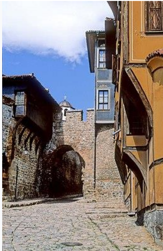
Straat in oude stad