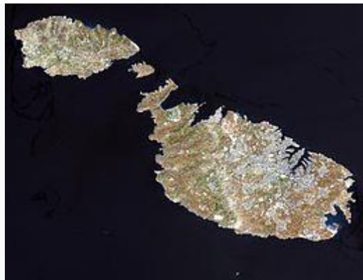
Satellietbeeld van Malta